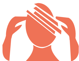
Déficiéce psychique ou maladie mentale